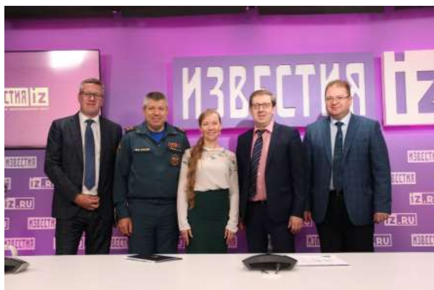
Пресс-конференция, посвященная Экодиктанту МИЦ «Изнестия», 31.08.2020